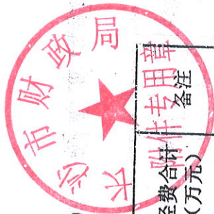
2021年省级教师培训项目资金分配明细表（教师培训、语言文字等工作）